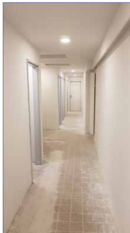
Sanitärgang nach dem Abbruch und mit Fortschritt der Ausbaurbeiten

Im Frühjahr folgen dann die Duschen und Umkleiden. Durch bauliche Änderungen soll dabei auch die Umkleide- und Toilettensituation des Jahnzimmers verbessert werden. Aus Kostengründen wollen wir wieder das ein oder andere in Eigenleistung erbringen. Wenn ihr mitanfassen möchtet, meldet euch gerne beim Vorstand.