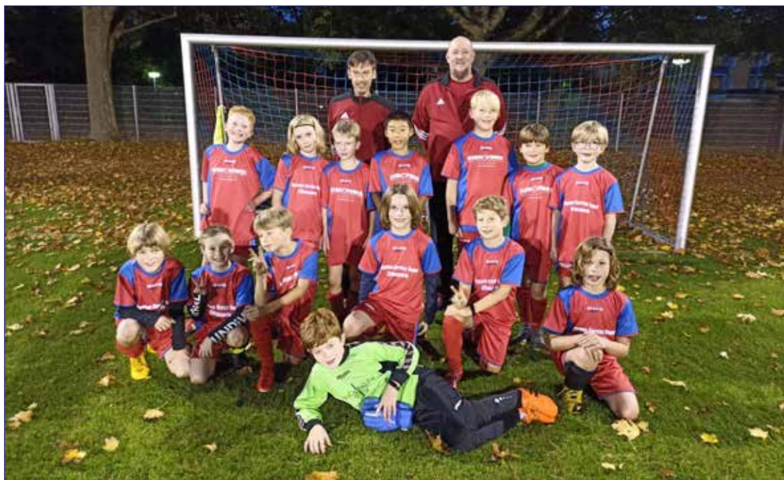
Teamfoto nach dem letzten Staffelspieltag ...