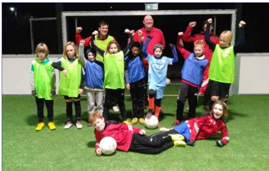
...und ausgepumpt nach dem Training in der Kalthalle