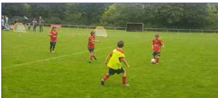
Spielezene aus dem Funino-Spiel unserer Teams