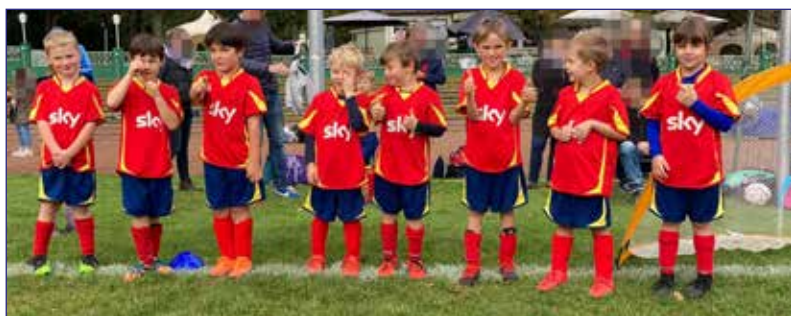
Teamfotos von den Turnieren