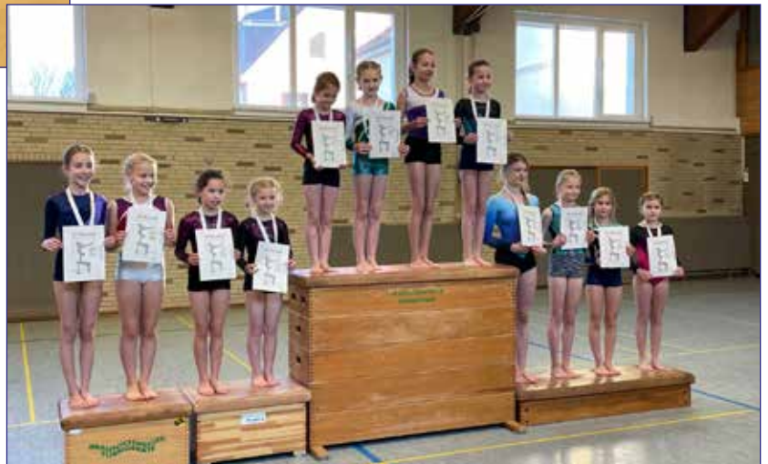
Sehr gute Leistungen der Gruppe Fortgeschritten 1 im internen Teamwettbewerb - Herzlichen Glückwunsch!