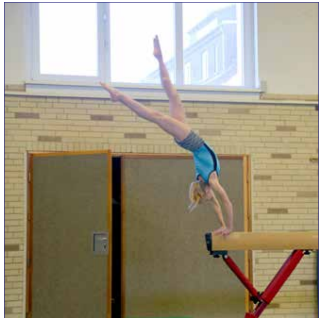
Eine anspruchsvolle Übung (P7) am Schwebbalken in den letzten Zügen