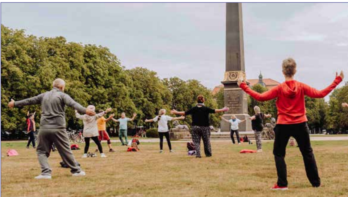
Qigong auf dem Löwenwall