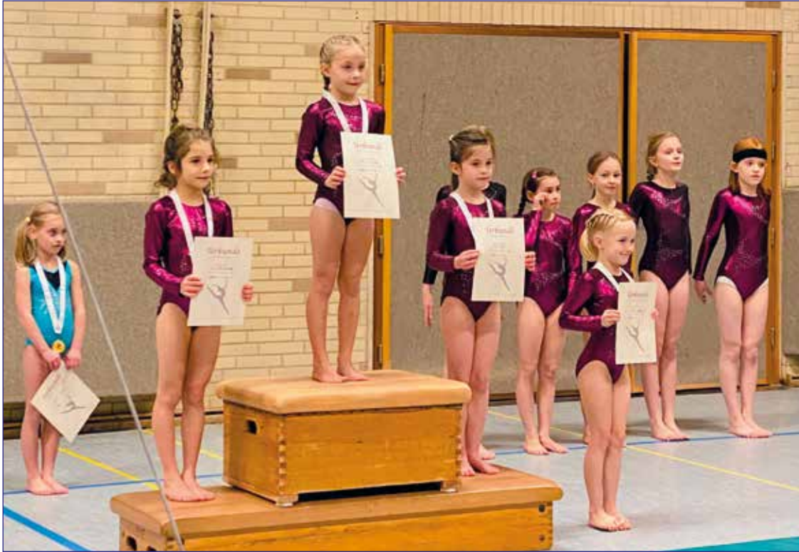
Die Nachwuchstalente der Turngemeinschaft SCE Gliesmarode/TSV Schapen im internen Wettbewerb

Zum Jahresabschluss gingen im Nachwuchsbereich der Leistungsturnerinnen (Talentgruppen) die Turnerinnen der Pflichtübungen P5 und P6 im internen Wettbewerb an den Start. Geturnt wurde an den vier Geräten Sprung, Stufenbarren, Balken und Boden. Die jungen Talente zeigten mit viel Körperspannung und Konzentration ihr Können. Mal wurde geklatscht und angefeuert, dann wieder leise mitgefiebert. Die Reckübungen waren hier ein Highlight. Da dürft ihr wirklich stolz sein.