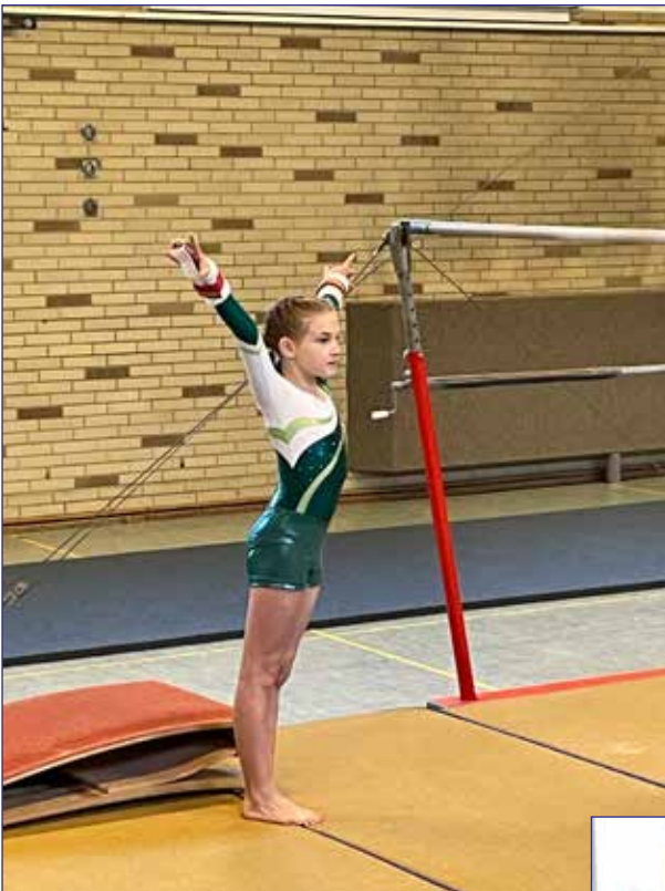
Mit hoher Konzentration und einer herausragenden Körperspannung vor der Übung am Stufenbarren